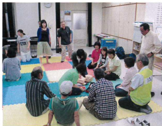
※ 実機使用による実習