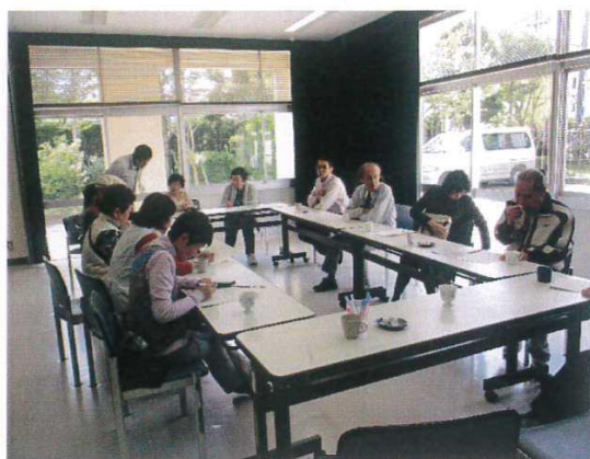
※ 終了後に談話会を実施