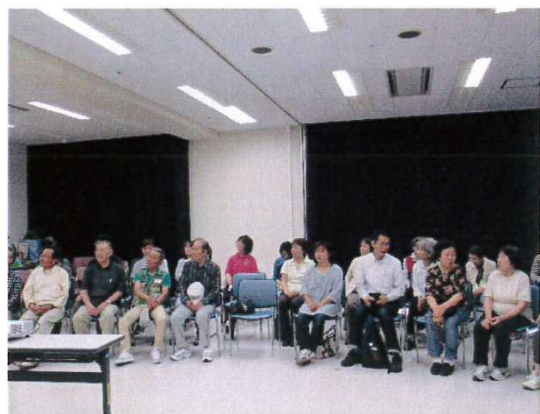
※ DVDによる応急手当紹介